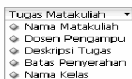
Gambar 1: Entitas pertama dalam contoh model data untuk database tugas matakuliah.

Entitas utama untuk database tugas matakuliah tentu saja Tugas Matakuliah. Sebagian atribut yang dimiliki entitas ini tertera dalam Gambar 1.