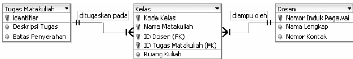
Gambar 3: Ketiga entitas utama dalam model data dan hubungan antar masing-masing entitas.

Karena beberapa alasan tersebut, entitas Dosen pada model data kita akan menggunakan pengidentifikasi arbitrer berupa Nomor Induk Pegawai sebagaimana diperlihatkan dalam Gambar 3. Dalam notasi crow's foot , relasi non- identifying digambarkan dengan garis putus-putus atau tersamar.